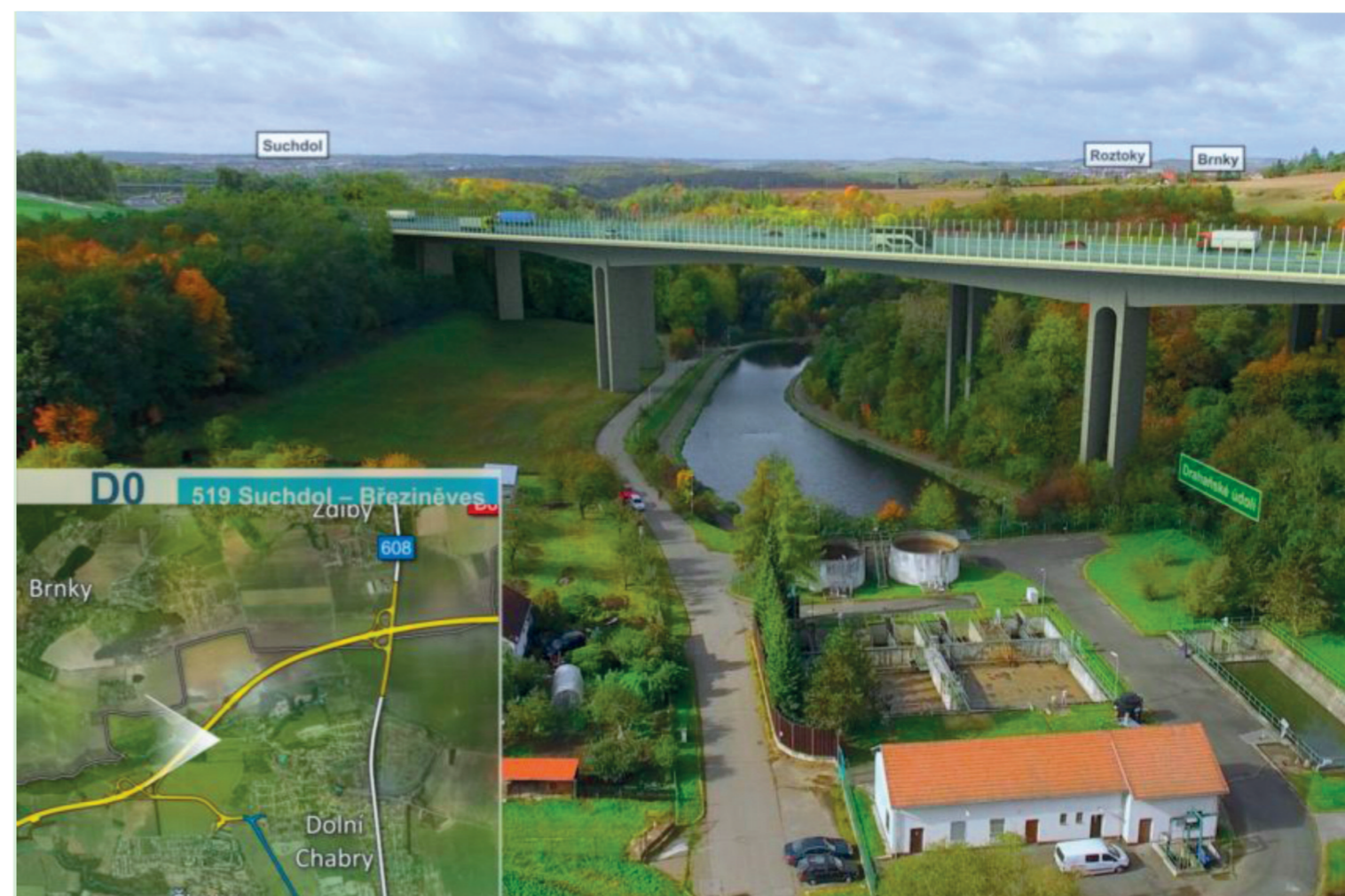
Most přes Drahaňské údolí – konec oblasti klidu a rekreace (přírodní park Drahaň – Troja)