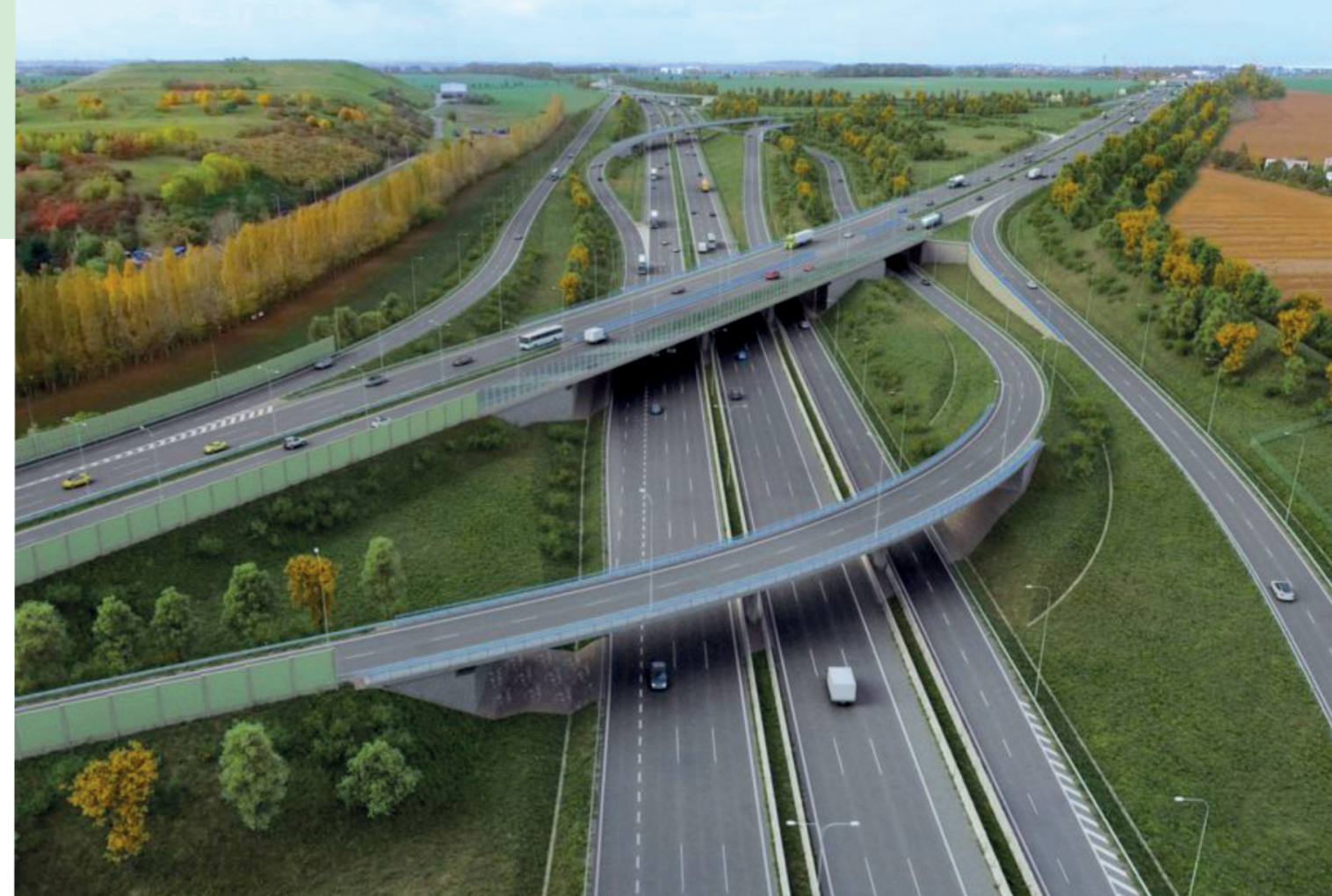
Mimoúrovňová křižovatka s označením Březiněves, přestože leží na území podstatně většího sídla – tedy Ďáblic