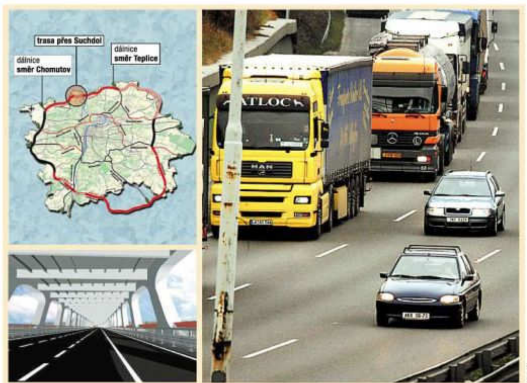
VÍTĚZSTVÍ SUCHDOLSKÝCH. Soudci Nejvyššího správního soudu zrušili změny územního plánu hlavního města Prahy. Znamená to, že je zastavena stavba nové ranveje letiště v Ruzyni a také část obchvatu Prahy.

Suchdolští magistrát kritizovali mimo jiné proto, že vliv obou staveb na jejich městskou část posuzoval samostatně. Nebylo tak například jasné, jak se obě stavby společně projeví na hladině hluku v obci.